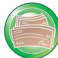
Alta velocidad de escaneo