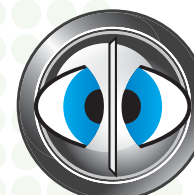
Escanea ambos lados