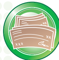
Alta velocidad de escaneo